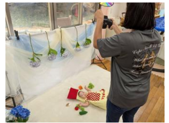
ベビーフォト体験会